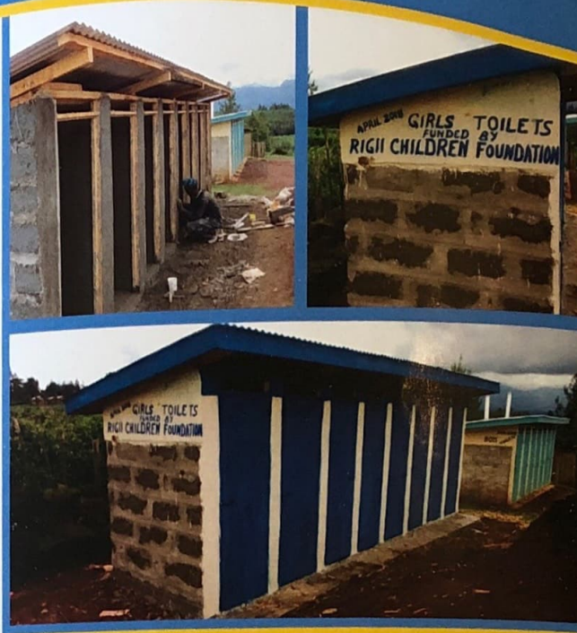
Hierboven de bouw van een meisjes-toilet voor een school.